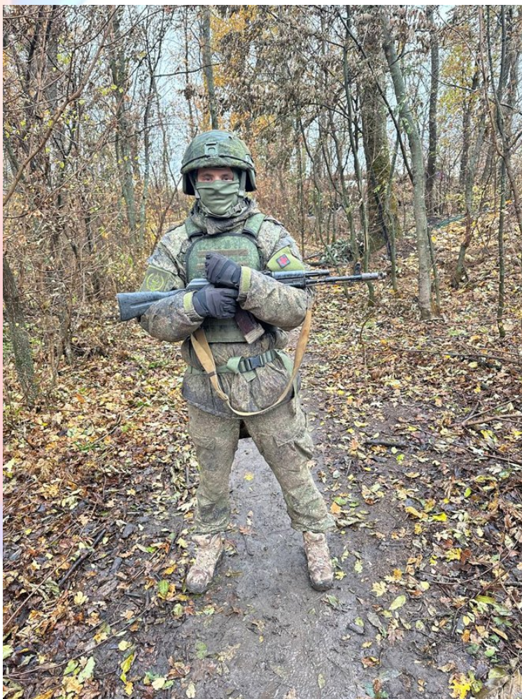
Гвардии прапорщик (фельдшер), позывной «Медик»

Цель проекта: Основная цель проекта заключается в воспитании патриотических чувств через осознание значимости личного вклада каждого человека в историю своей семьи и страны.