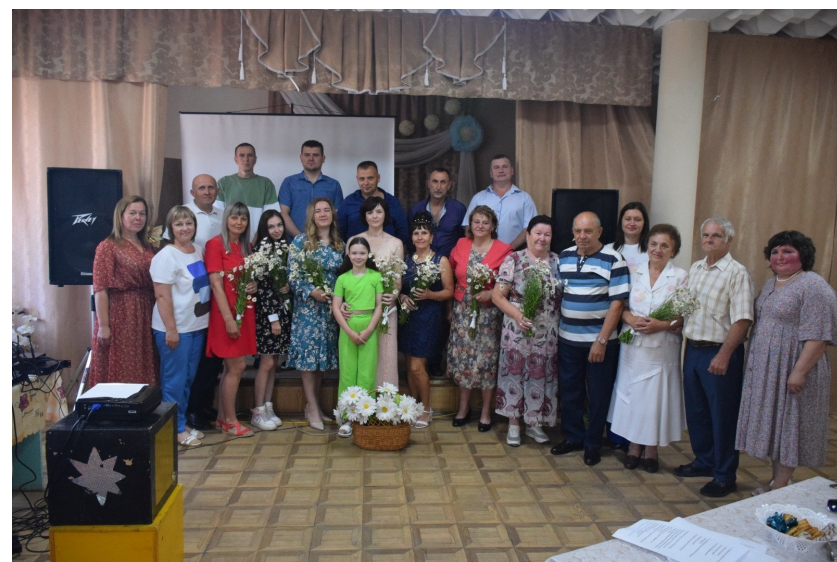
Министерство Смоленской области по внутренней политике, отдел муниципальной службы, мониторинга и содействия развитию местного самоуправления