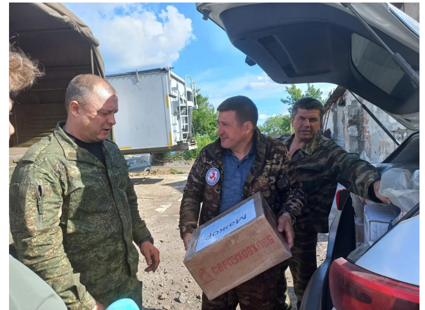
Министерство Смоленской области по внутренней политике, отдел муниципальной службы, мониторинга и содействия развитию местного самоуправления