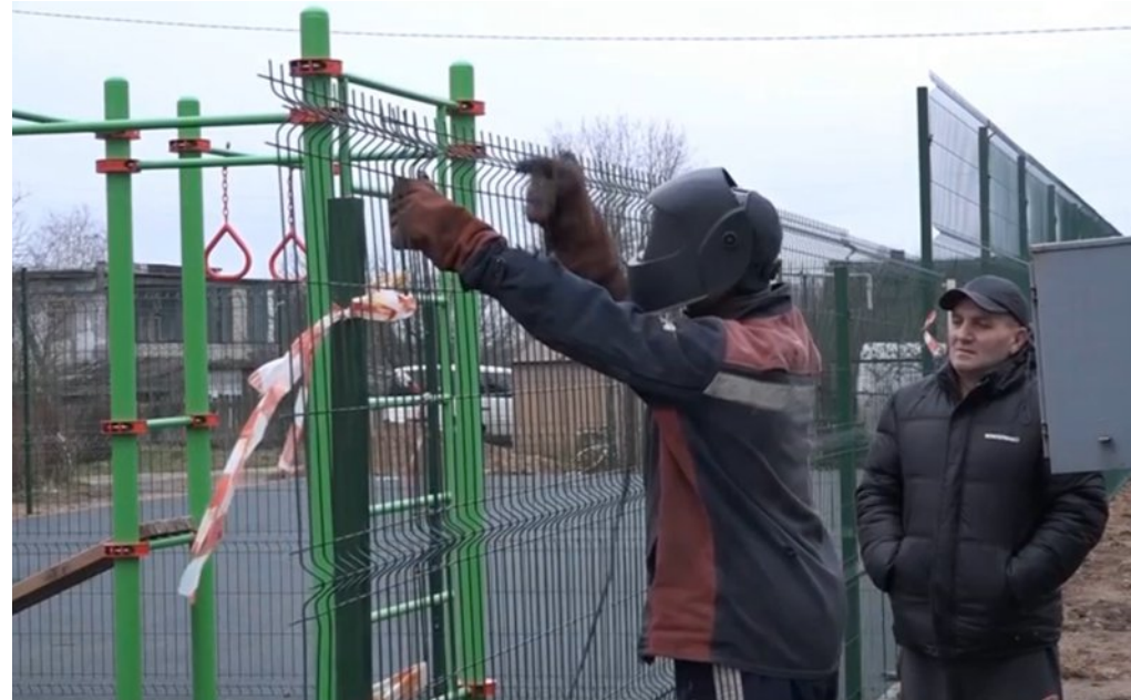
Министерство Смоленской области по внутренней политике, отдел муниципальной службы, мониторинга и содействия развитию местного самоуправления