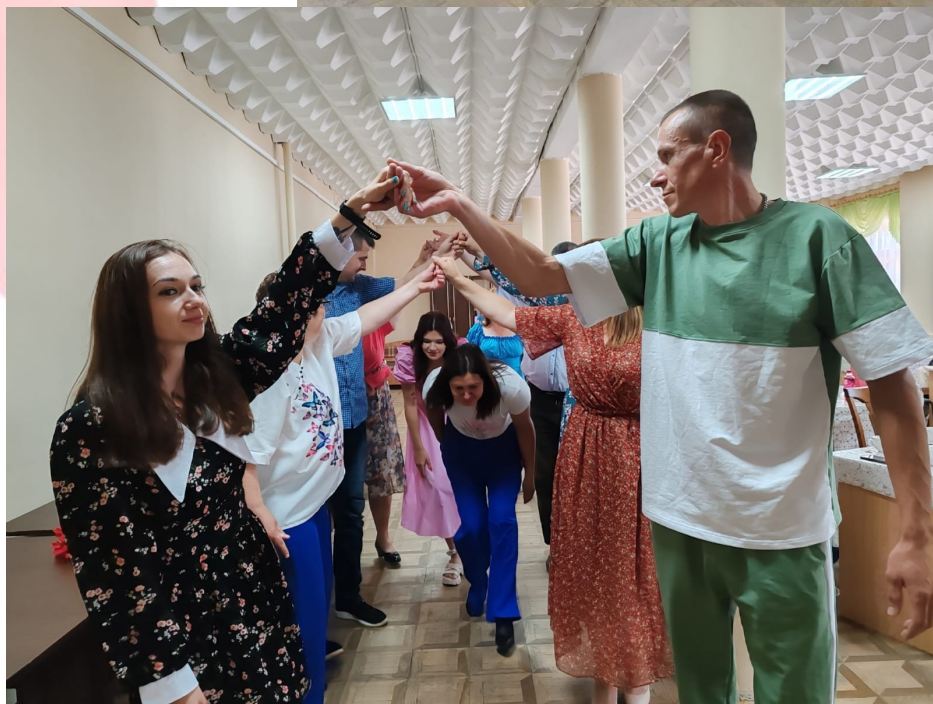
Большие семейные выходные