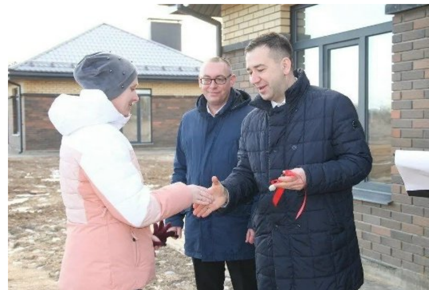
Строительство домов для молодых специалистов и аграриев