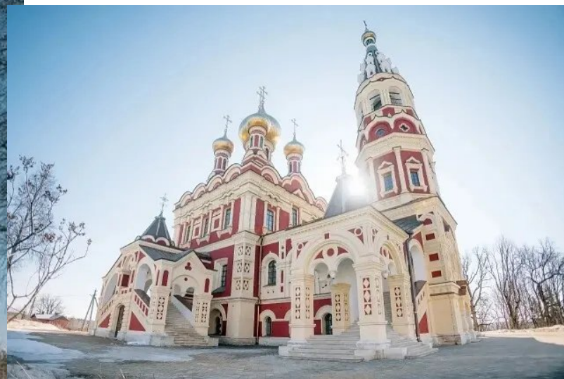
Министерство Смоленской области по внутренней политике, отдел муниципальной службы, мониторинга и содействия развитию местного самоуправления