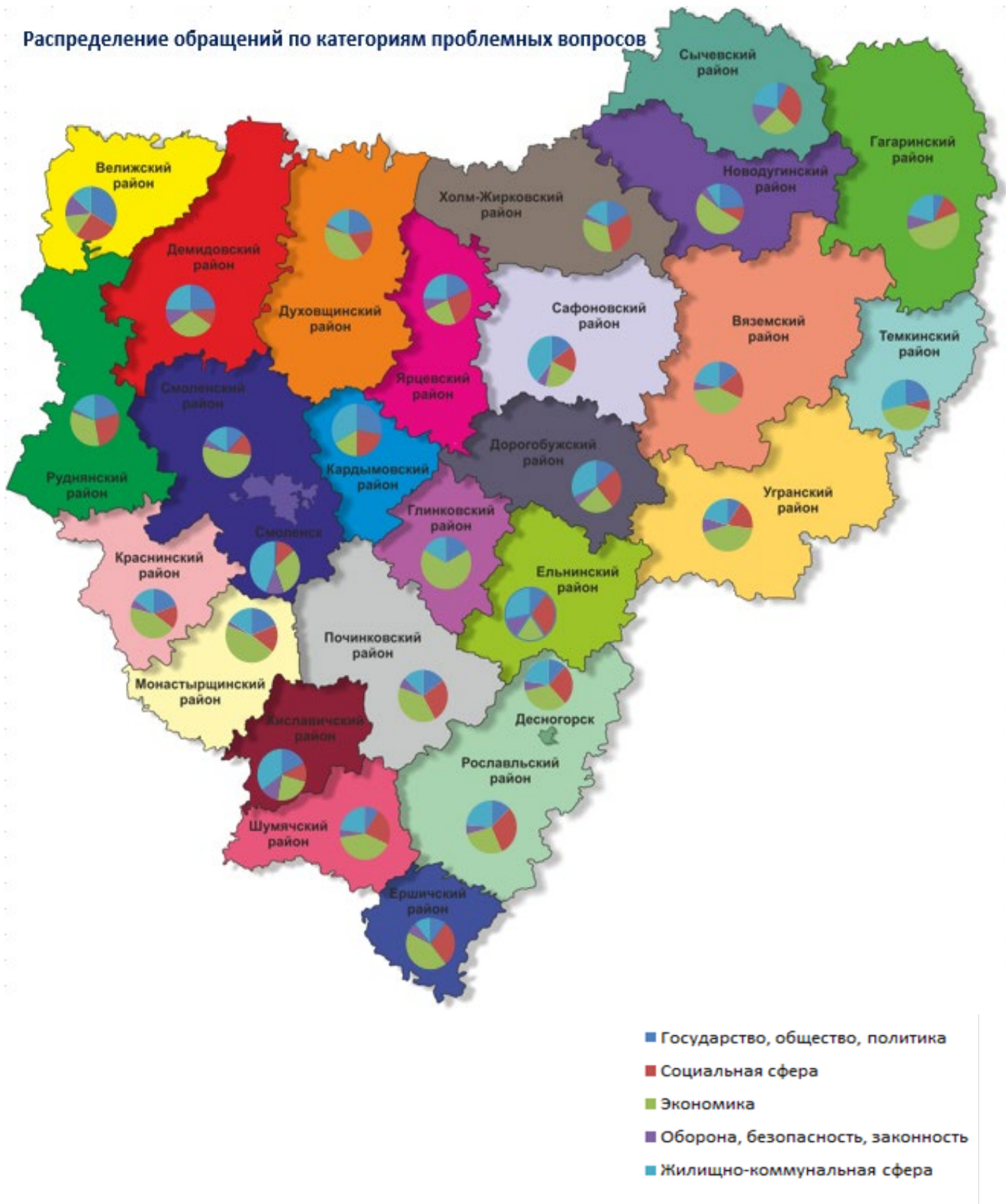
Распределение обращений по категориям проблемных вопросов